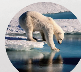
지구 평균 기온 상승