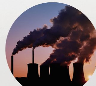
온실가스, 온실 효과

온실 효과는 대기 중 온실 기체(수증기, 이산화탄소)에 의해 지구의 표면 가까이에서 열이 갇히는 것을 의미한다. 이 열을 가두는 온실가스는 지구를 감싸는 담요로 생각할 수 있다.