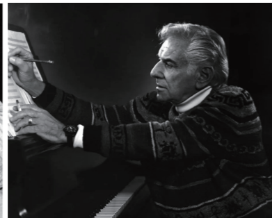
레너드 번스타인 빈 필하모닉 오케스트라