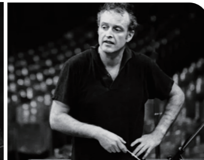
카를로스 클라이버 바이에른 국립 교향악단 오케스트라

2 오케스트라 총보를 보고 구성 악기를 분석한 후, 음색을 구별하여 감상해 보자.