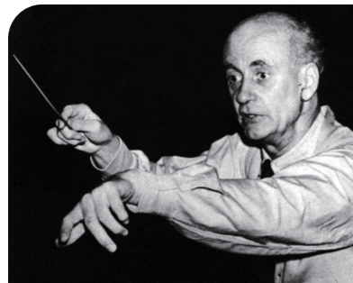
빌헬름 푸르트벵글러 베를린 필하모닉 오케스트라

1 다양한 음반을 찾아 비교 감상하며, 자신의 음악적 취향을 발견하고 감상 경험을 공유해 보자.