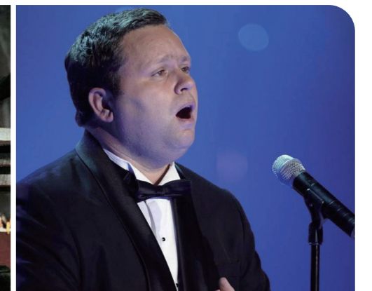
브리트즈 갓 탤런트(2007) 폴 포츠