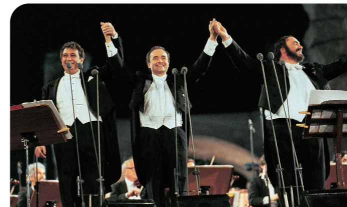
이탈리아 월드컵 전야제(1990) 플라시도 도밍고, 호세 카레라스, 루치아노 파바로티