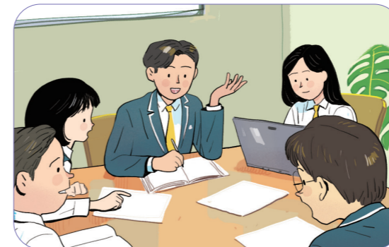
3 라디오 주제를 선정한다(예시: 갈팡질팡 나의 길).