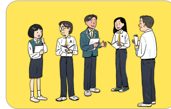
1 5~6명으로 모둠을 구성한다.