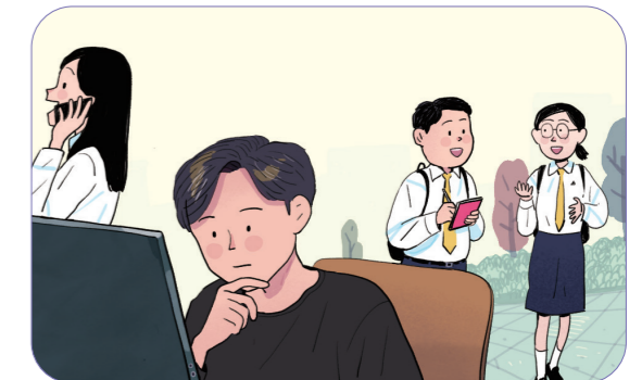
4 친구들의 사연을 수집한다.