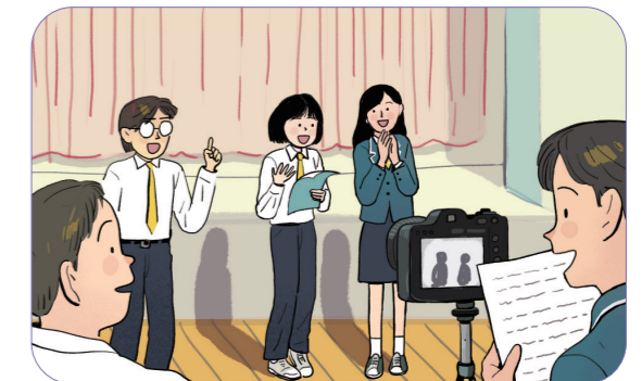
6 보이는 라디오를 진행한다.