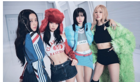
블랙핑크 'Shut Down'