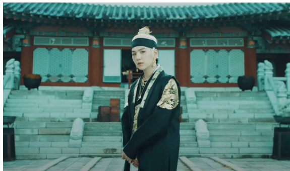
Agust D(방탄소년단 슈가)의 '대취타'