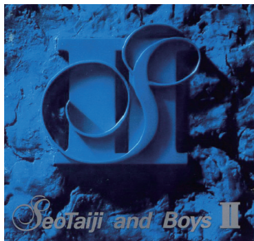
앨범 <Seo Taiji and Boys II > 중 '하여가'