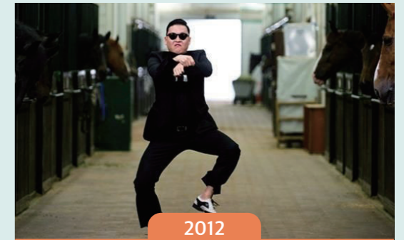
2012 30개국 이상의 음악 차트에서 1위를 한 싸이의 '강남스타일'