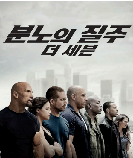
영화 「분노의 질주: 더 세븐」