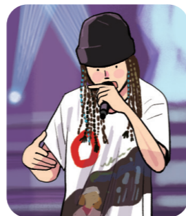
랩과 함께 리듬감이 특징인 힙합