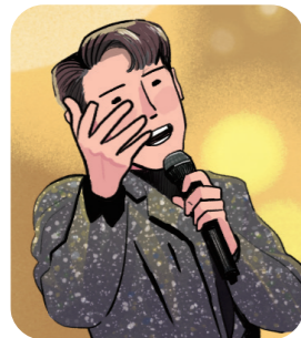
정형화된 리듬으로 구성된 음악 트로트

대중음악(Popular Music)은 많은 사람이 즐기고 대중 매체로 전파되는 음악을 말한다.