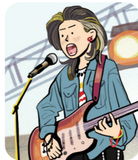
강한 비트의 음악 록