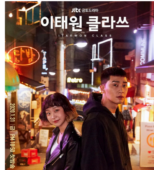
드라마 「이태원 클라쓰」