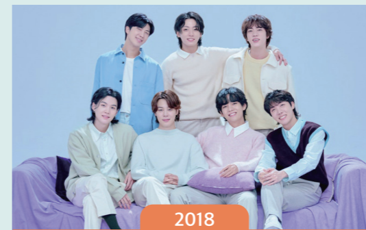
2018 방탄소년단, K-POP 그룹 최초로 2년 연속 미국 빌보드 뮤직 어워드에서 톱 소셜 아티스트상 수상