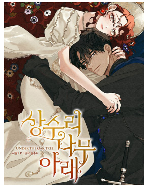
웹툰 「상수리나무 아래」