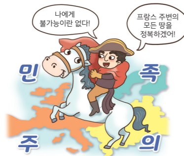
프랑스 혁명과 나폴레옹 전쟁