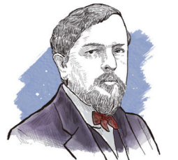
드뷔시 Debussy, Claude Achille (1862~1918, 프랑스) • 인상주의 음악가 • 「베르가마스크 모음곡」 중 '달빛' 등

문학적 표제를 지닌 단악장의 관현악곡으로, 리스트가 창시하였으며 자유로운 형식으로 작곡한다.