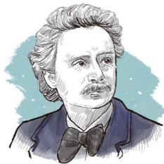
그리그 Grieg, Edvard Hagerup (1843~1907, 노르웨이) • 민족주의 음악가 • 피아노 협주곡 Op. 16 등