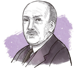
슈트라우스(리하르트) Strauss, Richard Georg (1864~1949, 독일) • 후기 낭만주의 작곡가 • 오페라 「살로메」 등