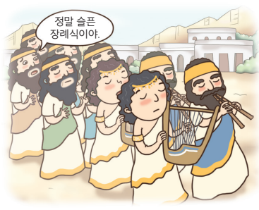
종교 의식이나 행사를 위한 음악이 발달