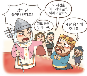
종교가 정치, 사회, 경제, 철학, 문화를 지배